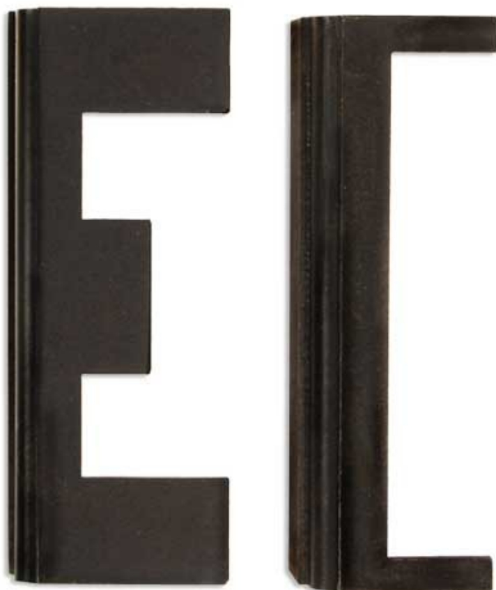
16, 17: Aretační zarážky vačkové hřídele jsou zhotoveny z kvalitní oceli.