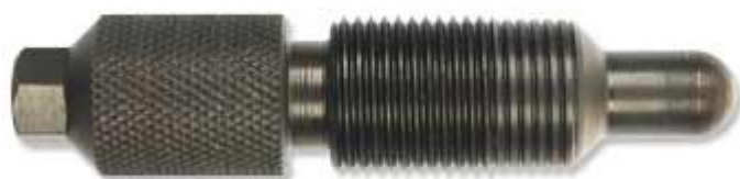
18: aretační čep rozvodových kol M18x1,5 pro motory TDI. Čepy jsou zhotoveny z kvalitní oceli, tepelně zušlechťeny.