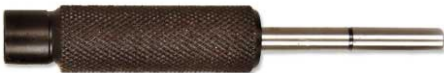
14: aretační čep rozvodových kol průměr 6 mm, broušený