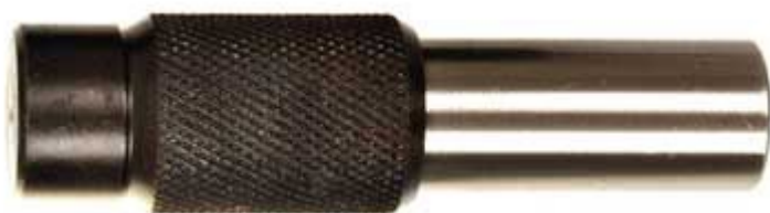
13: aretační čep rozvodových kol průměr 15,4 mm, broušený.