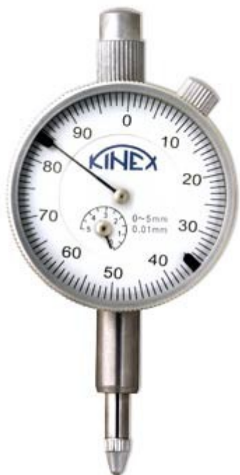
12: Indikační hodinky celokovové, průměr 40 mm, zdvih 5 mm.